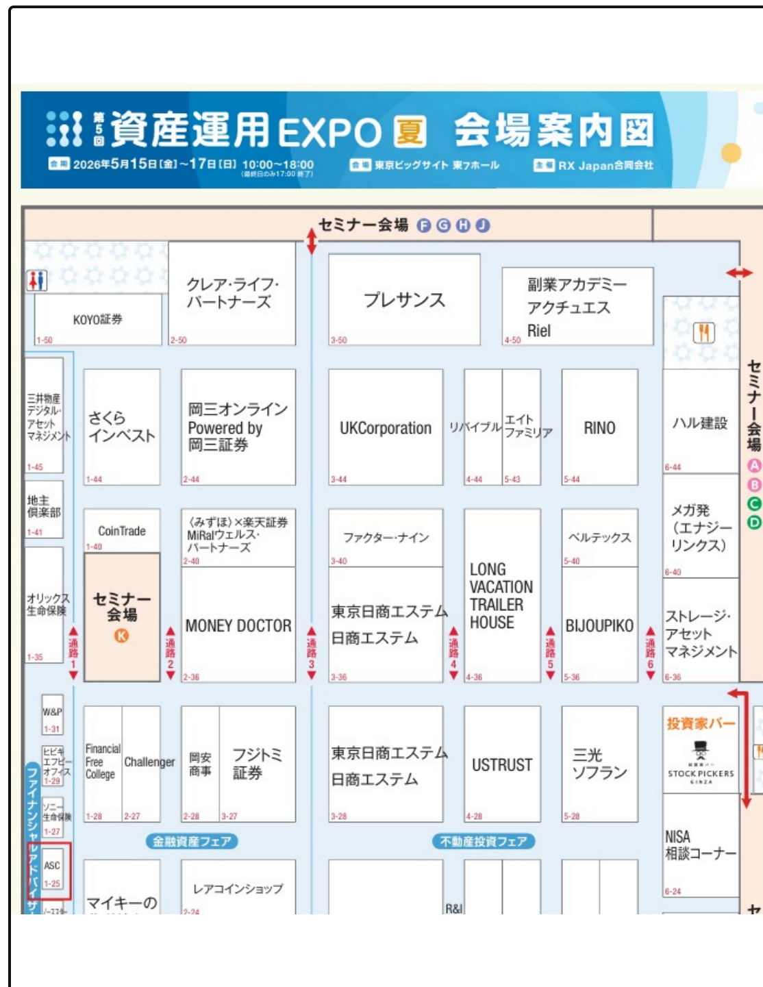
会場マップ (ASCブース：1-25 ファイナンシャルアドバイザーエリア)